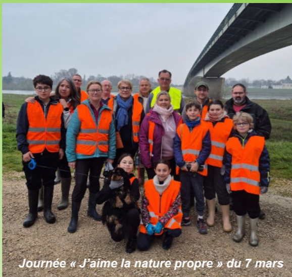
Journée « J'aime la nature propre » du 7 mars

Un nettoyage des déchets a été fait sur les bords de la Loire côtés Veuzain et Chaumont le samedi 07 mars 2026. Ce nettoyage réunissait des élus du conseil municipal, du conseil municipal des jeunes et des administrés.