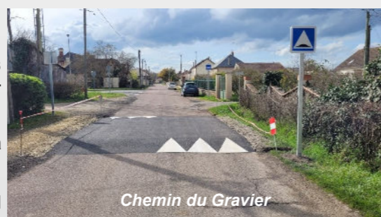
Chemin du Gravier

Un second aménagement appelé « plateau » a été installé fin février à proximité du carrefour de la gare, Chemin du Gravier.