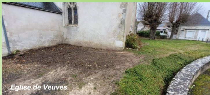
Eglise de Veuves

Le projet de désimperméabilisation et de végétalisation de la cour de l'école Jacques Prévert avance. Après un important travail des enseignants et des enfants, les études sont dorénavant presque abouties. Une consultation va être lancée prochainement et un architecte paysagiste prendra le dossier en mains pour en tirer des plans selon les volontés et les souhaits des enfants, des enseignants, des parents d'élèves et des élus. Mais, un peu de patience, les travaux ne débiteront qu'à l'été 2025 durant les congés scolaires.