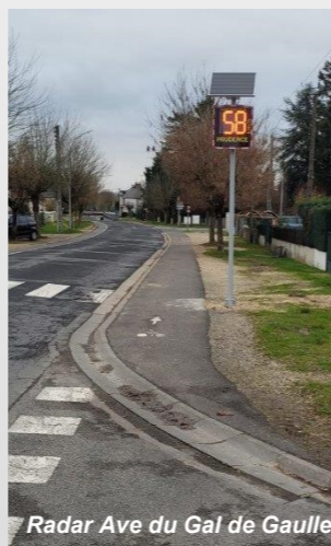
Radar Ave du Gal de Gaulle

FACE A LA RECRUESCENCE DES VITESSES EXCESSIVES SUR LE TERRITOIRE DE LA COMMUNE MERCI DE LEVER LE PIED.