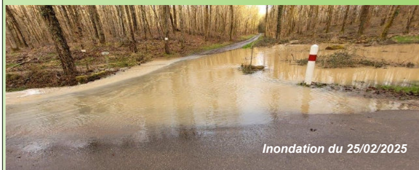
Inondation du 25/02/2025

Que d'eau, que d'eau... Après un automne très très humide, le début de l'année 2025 n'est pas en reste avec des pluies excessives provoquant une nouvelle inondation la dernière semaine de février. Heureusement, des curages de fossés faits en régie durant l'hiver ont atténué certains débordements.