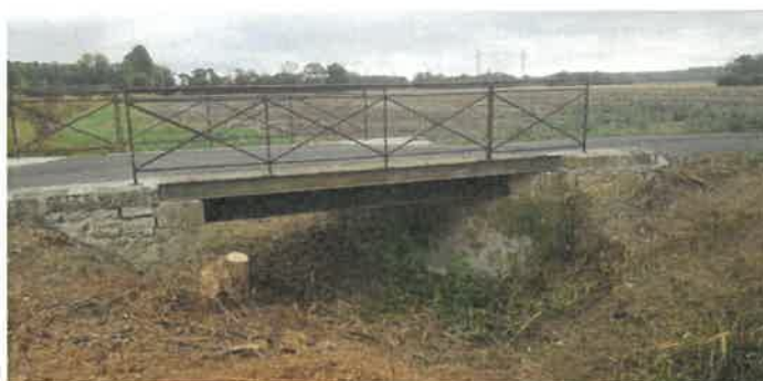
Pont chemin des Isles