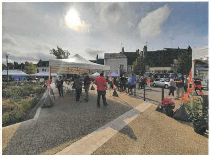
Forum des artisans et commerçants