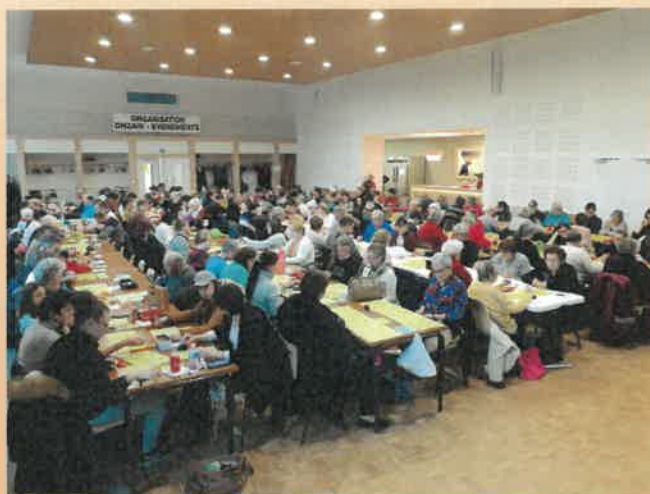
Loto 31 janvier 2020

Nous vous informerons de la tenue ou non de ces activités via les journaux locaux et le site internet de la ville.