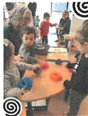
Atelier découverte des matières (début 2020)