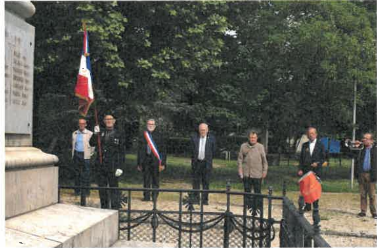
Cérémonie du 8 mai à Onzain