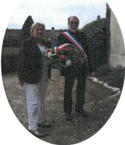
Cérémonie du 8 mai à Veuves