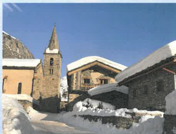
Bonneval sur Arc (Janvier 2020)

Ambiance amicale et bonne humeur accompagnent toutes nos activités.