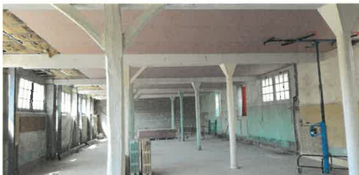
Clos des Oiseaux le 04.02.20