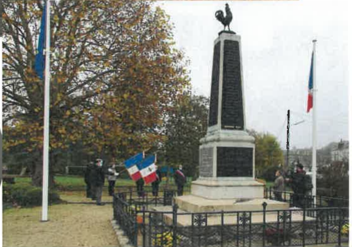
Cérémonie du 11 novembre à Onzain