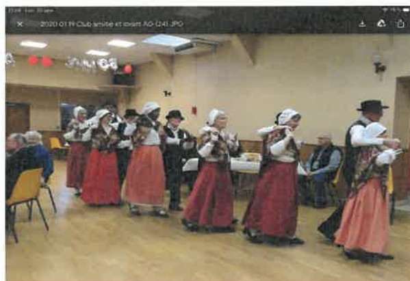
Prestation du 19 janvier 2020 à Herbault

E-mails : theresebuisson@orange.fr , lesfloralies.onzain@orange.fr