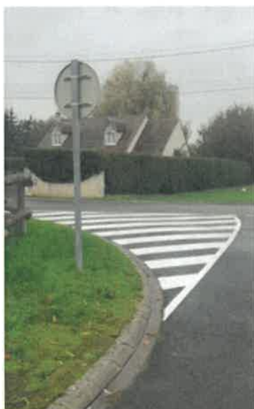
Zébras à Veuves