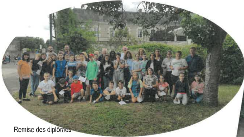
Remise des diplômes