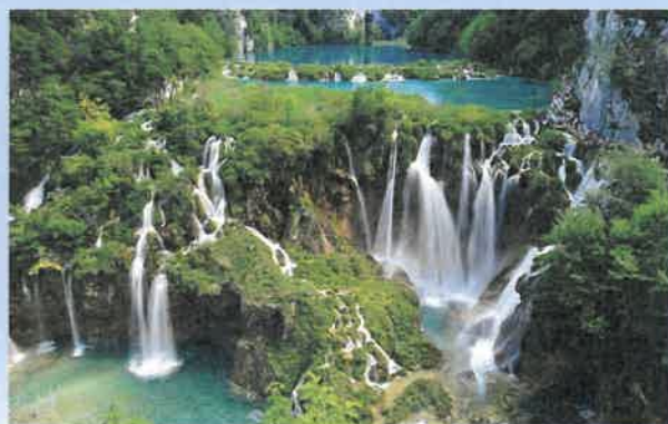
Prochain voyage dès que possible : Croatie (parc de Plivice)