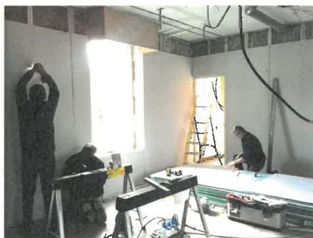
Travaux en régie à l'Espace 32

Tant pour la voirie que pour les bâtiments, nous avons amorcé une montée en puissance des travaux exécutés en régie. Plusieurs réalisations nous confortent dans ce choix, ce qui nous permet de générer des économies et valoriser le savoir-faire des agents des services techniques, que je tiens à remercier ainsi que leur nouveau responsable Moustafa Baddi, pour leur implication.