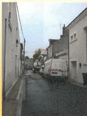
Rue du Château

Par ailleurs, nous continuons notre programme de remplacement des lampes les plus énergivores de notre réseau d'éclairage public, 25 000 € en 2020 et 25 000 € en 2021.