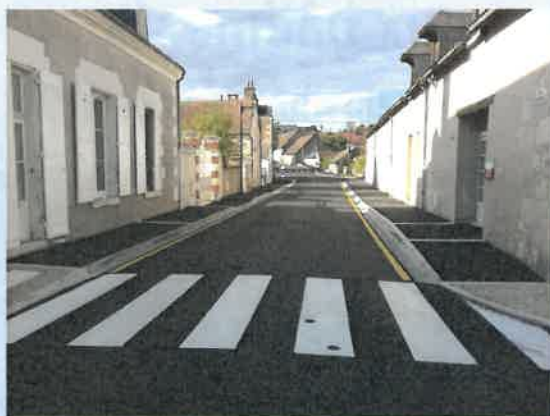
Rue des Rapins