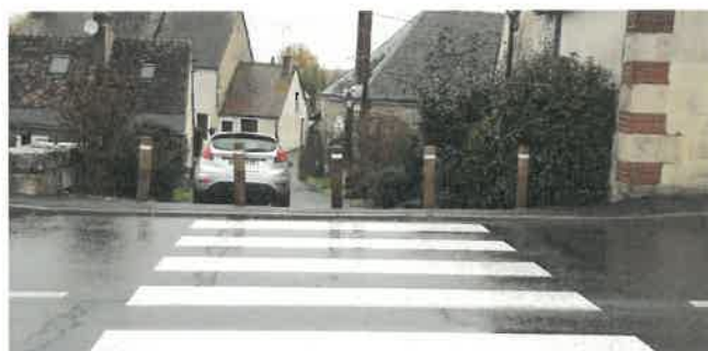
Quilles en bois à Veuves