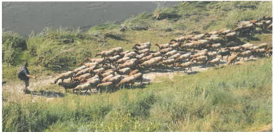
Transhumance en bords de Loire