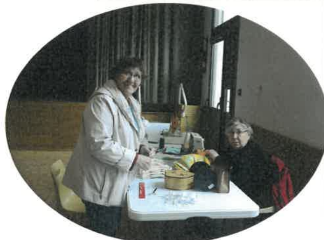
Fabrication de masques