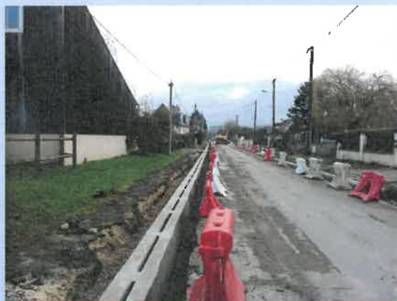
Route de Chouzy

Les deux tronçons restant à réaliser Rue des Fossés Jean Tiré pour arriver Rue G. Diard sont d'ores et déjà programmés.