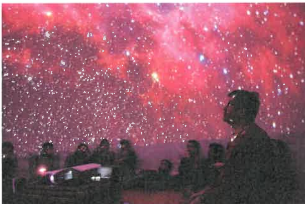
Atelier astronomie à l'école Prévert