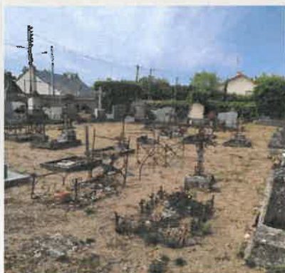
Carré des enfants aujourd'hui

Deux options. Si la famille renouvelle la concession, les restes demeurent dans la tombe. Dans le cas où la famille ne se manifeste pas ou ne souhaite pas reprendre la concession, la commune procède à l'exhumation. Les ossements sont placés alors dans l'ossuaire de la commune.