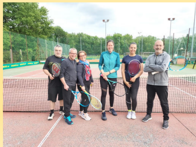
Groupe Débutant du lundi soir