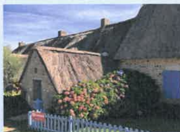
St Lyphard (parc de la Brière)