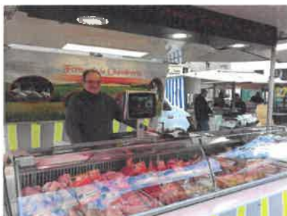
Ferme de la Chambrerie