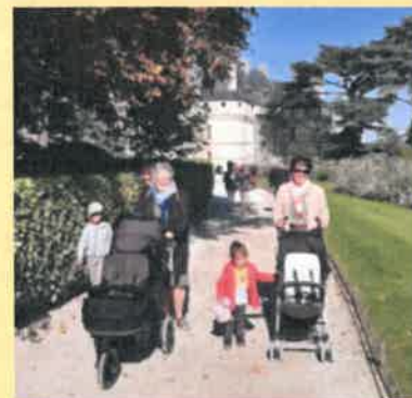
Balade aux jardins de Chaumont