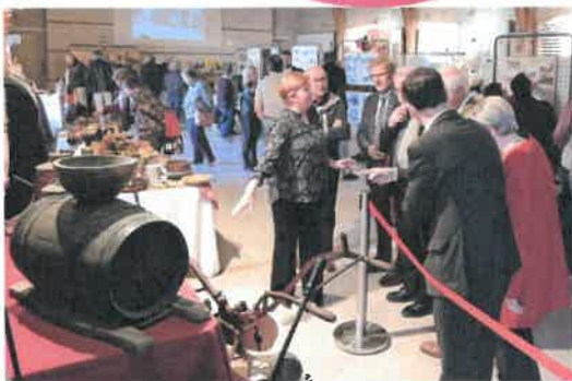
Expo Loir-et-Cher 1900