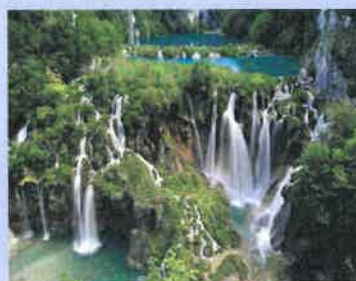
Croatie (parc de Plivice)