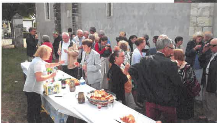
Fête de la Saint-Gilles