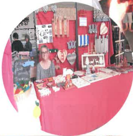
Salon des artistes amateurs