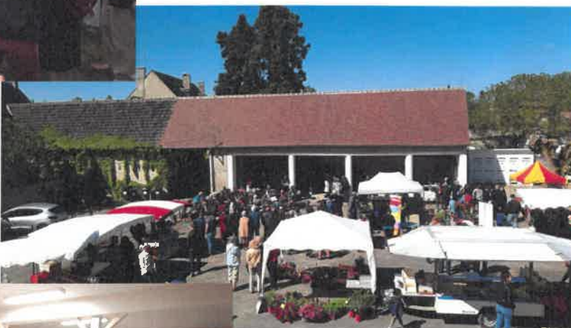
Marché des Vikings