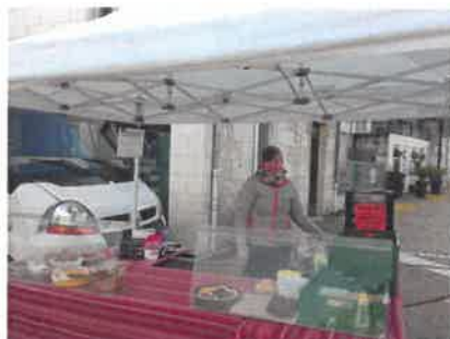
Gourmandises de chez Mimi

D'autres commerçants vous attendent tous les jeudis sur la place alors venez les rencontrer !