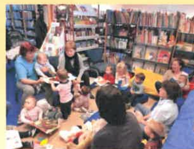
Séance Bébés lecteurs à la Médiathèque