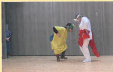
Spectacle de Noël réalisé par les assistantes maternelles