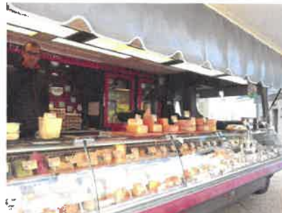
Raimbault & Fils