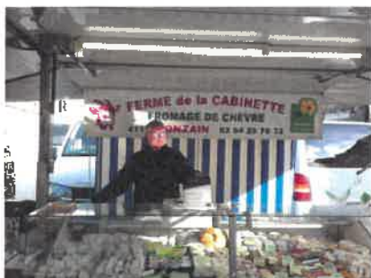
Ferme de la CabINETTE