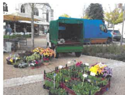
Au Plaisir du Jardin