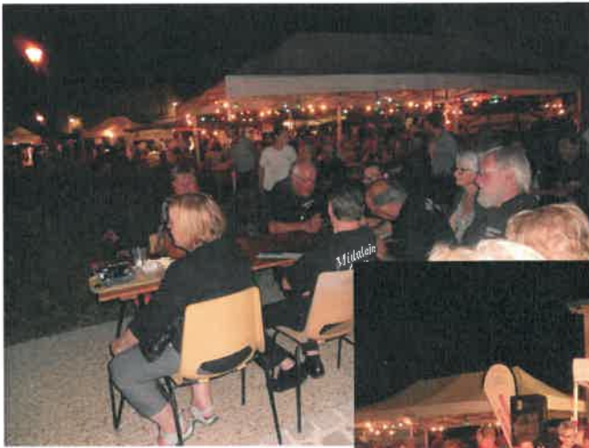
Marché de nuit-moules-frites